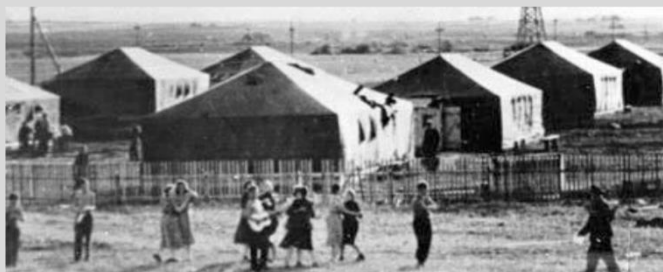
Палаточный городок, установлен в 1953 году