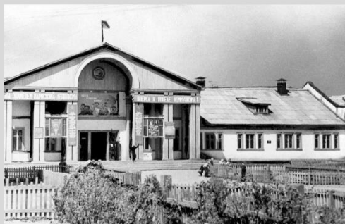
Клуб «Строитель», построен в 1957 году