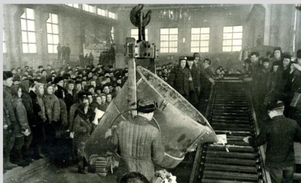
Первый алюминий. 1962 год