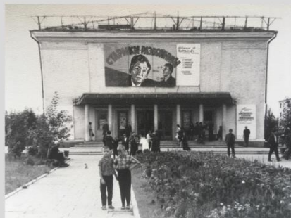
Кинотеатр «Юность», построен в 1963 году