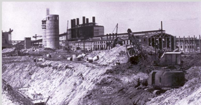
Строительство комплекса электротермического цеха алюминиевого завода. 1959 год