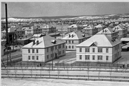
Первые двухэтажные деревянные дома, строились в 1959 году в 10-11 кварталах