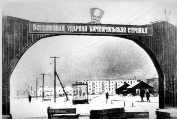
Деревянная арка «Всесоюзная ударная комсомольская стройка», установлена в 1960 году